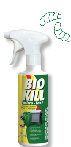
BIO KILL CONTAINER- SPRAY