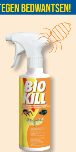
BIO KILL KLEERMOT HUISSTOFMIJT BEDWANTS