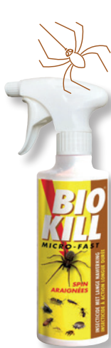
BIO KILL SPIN