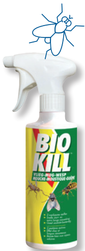
BIO KILL VLIEG MUG WESP