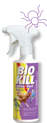
BIO KILL BIRDS