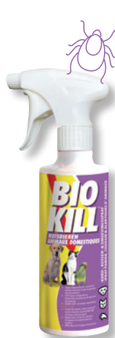
BIO KILL HUIS- DIEREN